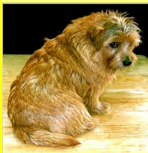
Norfolkterrier med överblommad päls, redo för trimning