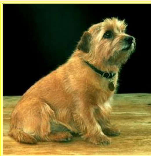
Mycket bekvämare och tillfreds med sig själv